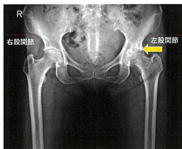
前から見た左変形性股関節症のレントゲン写真