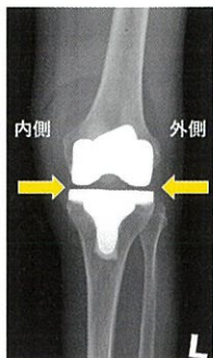
人工関節手術後のレントゲン写真