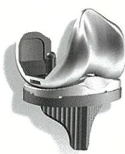
人工膝関節インプラントの一例