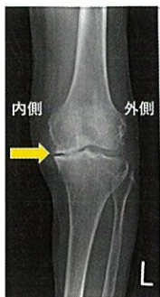
前から見た左変形性膝関節症のレントゲン写真