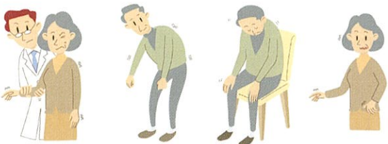
筋肉のこわばり 姿勢異常 無動 振戦