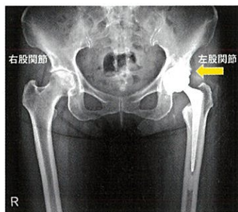
手術後のレントゲン写真